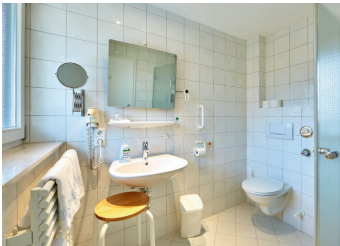
Patientenzimmer der Kategorie VITAL mit eigenem Bad, WC und Dusche sowie elektrisch verstellbarem Bett.