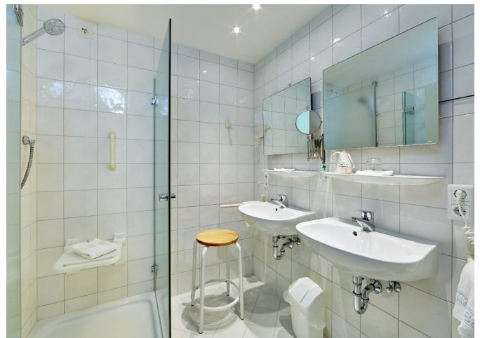
Patientenzimmer der Kategorie VITAL PLUS mit Balkon, eigenem Bad mit WC und Dusche sowie mehrfach elektrisch verstellbarem Komfortbett.